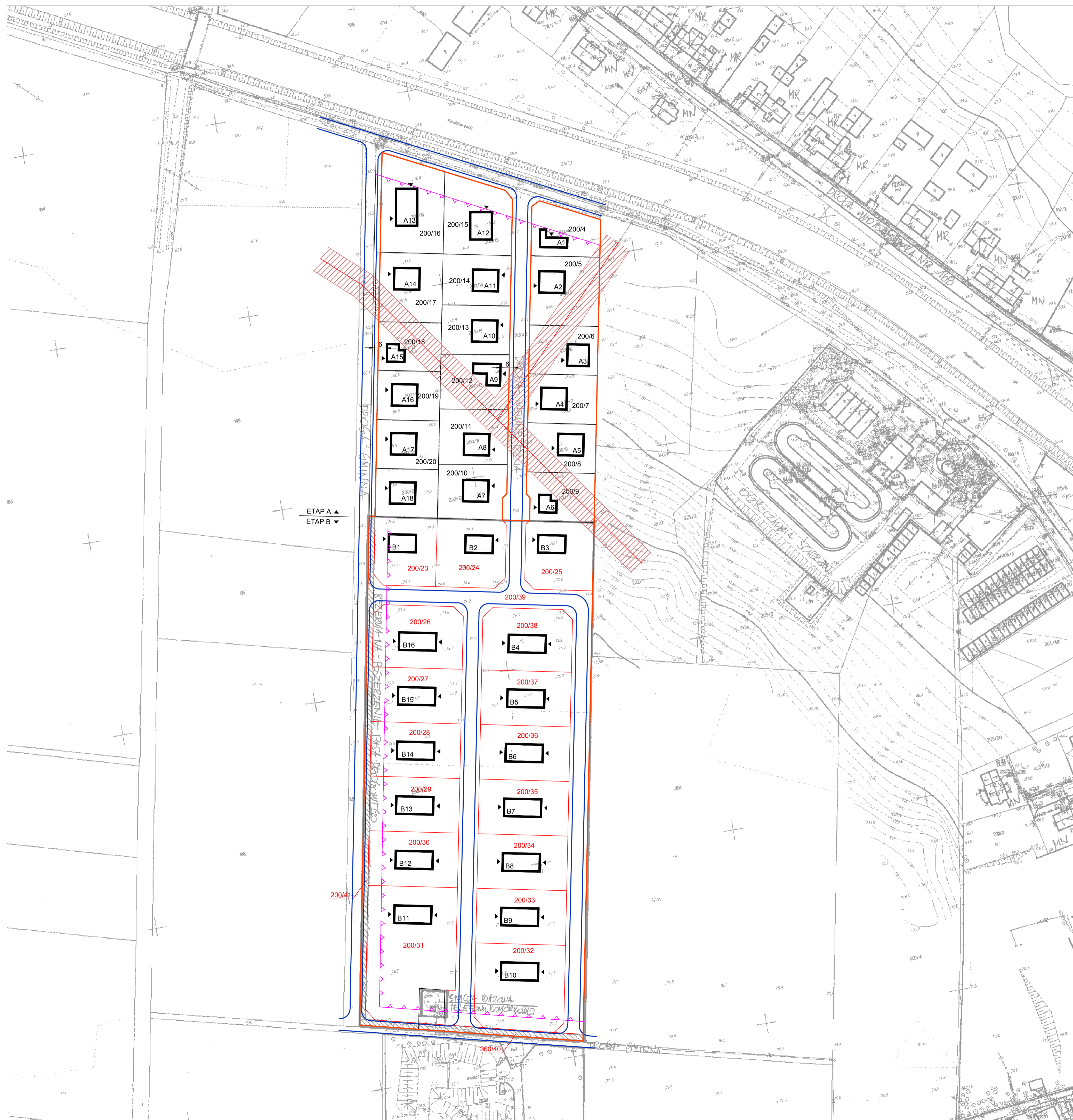
BILANS TERENU - ETAP A